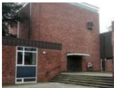
Heimat als Modellversuch