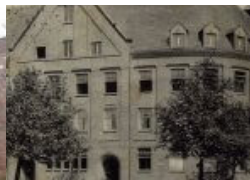
Stillstand beim Leerstand