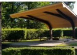
Sommer im Park 2020 fällt aus