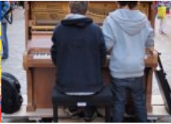
Urteil bringt Musikschulen in Bedrängnis