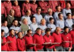
Deutschland singt zur Einheit