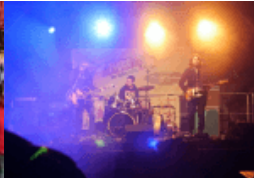
250.000 Euro für Gagen!