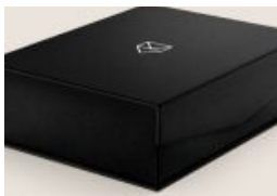
Kultur per Post