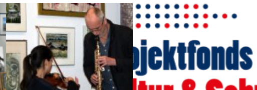
Entdecke Dich durch „Kultur & Schule“ ist ein Zeichen der ...