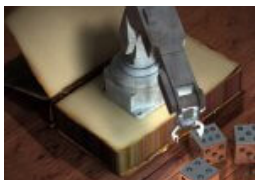
„Wir passten nicht ins Raster“