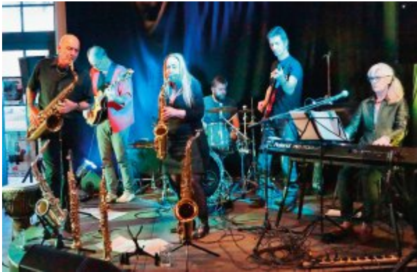
Bruder Schwarz jazt im Komm du

Klezmer und Tango bedient die Band „ Zorro Gris “ in der Marmstorfer Auferstehungskirche, Reggae und Roots der Musiker Elan Zack im Café „Komm du“ und für suburbanen Tanzsound sorgt das Stellwerk im Haeburger Bahnhof mit der „ Funk Soul Allnighter “-Nacht.