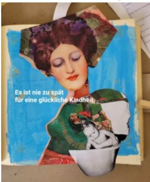
Kreative Umsetzung, so geht es!

Der künstlerische Ausdruck kann uns unterstützend helfen. Das Wortlose und Unausgesprochene will gesehen werden und ans Licht kommen. Gerade für den Blick zurück in die Kindheit hilft uns der künstlerische Ausdruck, um an die sprachlose Zeit anzuknüpfen. Wenn ich von Kunst spreche, dann meine ich den authentischen Ausdruck jenseits der Bewertung von Kunst. Ich möchte dir dazu ein praktisches Beispiel geben: Ich nenne die Übung „Es ist nie zu spät für eine glückliche Kindheit“. Für Menschen, die schlimme Erfahrungen in ihre Kindheit gemacht haben, mag das erst einmal zynisch klingen. Hier geht es aber nicht darum, die Kindheitserfahrungen zu relativieren, sondern heute im Hier und Jetzt für dein verletztes inneres Kind bzw. die inneren Kindern (denn meistens gibt es mehrere verletzte Anteile) zu sorgen. Dein inneres Kind hat einige Krisen bewältigt. Das verletzte innere Kind trägt deine negativen Erfahrungen und Glaubenssätze mit sich herum. Auch belastende Gefühle wie unverarbeitete Trauer oder Wut zeigen sich durch das innere Kind. Das verletzte Kind sucht zeitlebens nach Heilung, Nestwärme und Liebe. Du kannst für das innere Kind heute selbst eine liebevolle Mutter oder ein liebender Vater sein. Das kann man auch etwas weniger pathetisch Selbstfürsorge und Selbstmitgefühl nennen, woran es vielen Menschen fehlt. Wir haben die alten Muster und Glaubenssätze unserer Eltern übernommen und beschimpfen und kritisieren uns selbst.