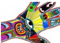
Mit der Kunst die Intuition einfangen