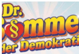
Dr. Sommer der Demokratie