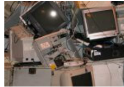
30 Jahre www