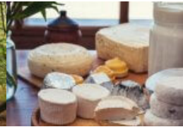
Gipfeltreffen des inneren Teams