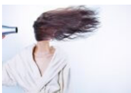
Dilettanten-Dilemma Heiliges XXL bzw. Doppel-D Kanonenrohr!