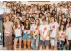
Das akustische Ich