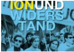
Visionen von Rebellion und Widerstand