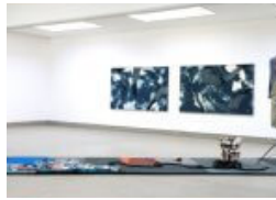
Kunst in der Wassermühle