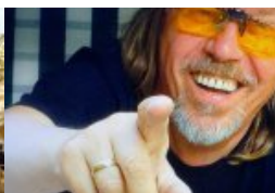
„Auf den Punkt!“