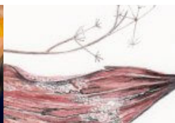
Bois du jour