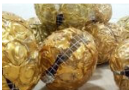
„Kann das Sünde sein?!“