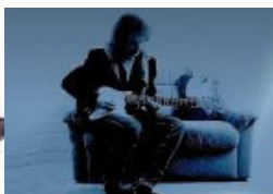
Künstlersozialkasse - die neue Serie