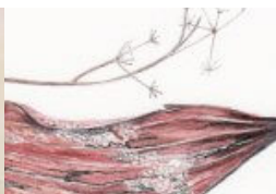
Bois du jour