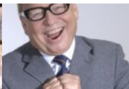
Choleriker trifft Heinz Erhard