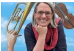
„Ein Klick zur Kultur“ 1001 Nacht in Seevetal