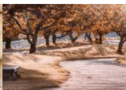
Auch der Herbst hat schöne Tage