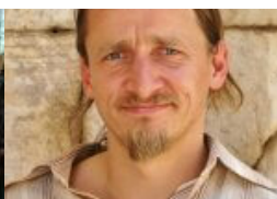
A Message in a Bottle