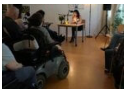
Hamburgs literarischer Wert