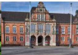
Harburg bekommt eigenen Kulturausschuss!