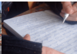
Schreibwettbewerb „Kann man da noch für Harburgs Schulen was machen?“