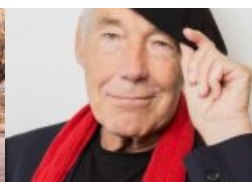
Bitterleichte Lyrik als Medizin