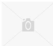
Kunst statt Kaffee und Kelims