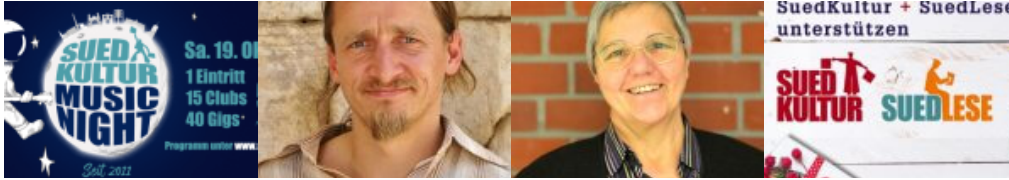
Musikbezirk Harburg! A Message in a Bottle