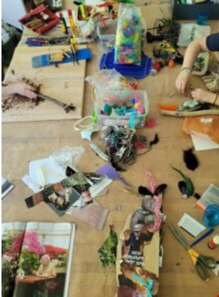
work in progress

Gehör zu verschaffen. Jeder Redestab trägt die Kraft derer, die ihn halten, und wird so zu einem Zeichen von Würde, Stärke und gemeinsamer Heilung.