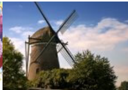
„Gelebte Traditionen in unserem Land“