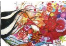
„Kunst braucht Freiheit!“