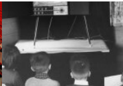
„Inklusive Bildung ist Gesetz!“