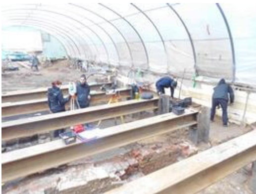
Blick auf die Ausgrabungsstelle an der „Neuen Burg“.

Im Herzen der Stadt, im Bereich der sogenannten Neuen Burg im Nikolai Quartier, führt das Archäologische Museum Hamburg ab sofort eine neue Ausgrabung durch. Bereits 2014 und Anfang 2017 haben die Experten des Museums Reste des Walles der Neuen Burg nördlich des Hopfenmarktes ausgegraben. Damals sorgten die Archäologen schon für eine Überraschung: Sie konnten durch dendrochronologische Untersuchungen nachweisen, dass die Neue Burg rund 40 Jahre älter war, als zuvor angenommen. Auf der aktuellen Grabungsfläche hoffen sie nun, neue wichtige Ergebnisse ermitteln zu können.