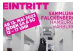
Kunst ohne Kosten!