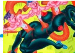
Die Ästhetiken des Virtuellen