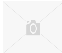
Die Enten sind los!