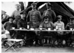
Die Bitte um Vergebung