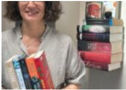
Stimmen der Gegenwart