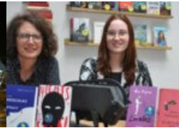
Female Shortlist der Jugendliteratur