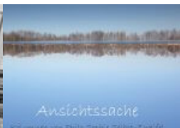
Ansichten einer Harburgerin