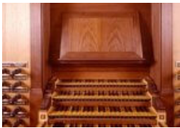
Landschaftspflege mit Pfeifen