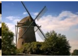
„Gelebte Traditionen in unserem Land“