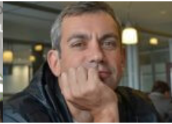
„Russendisko in der Elbphilharmonie“