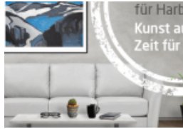
Holt Euch die Kunst nachhause!