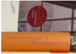
Die nicht wirkliche Wirklichkeit