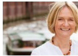
Kirsten Boie nimmt sich dem Nationalsozialismus an