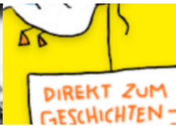
„Bücher für alle. Von Der Hamburger Anfang an!“