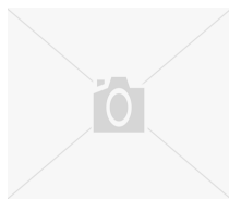
Gold stinkt nicht – Gift schon!