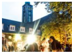
Das Schauspiel der Veddel