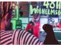
„the show must go online“