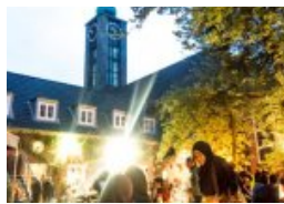
Das Schauspiel der Veddel