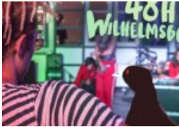
„the show must go online“