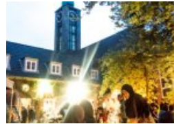
Das Schauspiel der Veddel