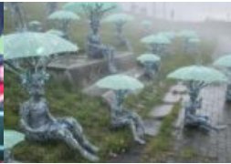
Wer tanzt Hamburgs Zukunft im Nebel?