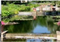
Denkmal im Wandern