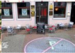
Last Minute Open Air Sommer