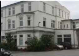
Residenz für internationale Kunst