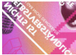
Wähl die Demokratie!