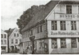
Auf den Spuren des alten Rathauses