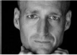
Ende der Stille