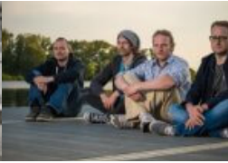
Franz Josef kann auch weh tun