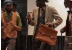
Zwischen Petticoat und Minirock