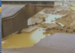
Dammbruch per Super8