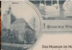
60 Jahre Museum im Marstall