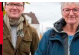
Von Comic-Welten bis zur weiblichen Revolution