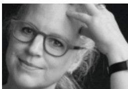
Humorvolle Vampire Leinen Los und das Alte Land