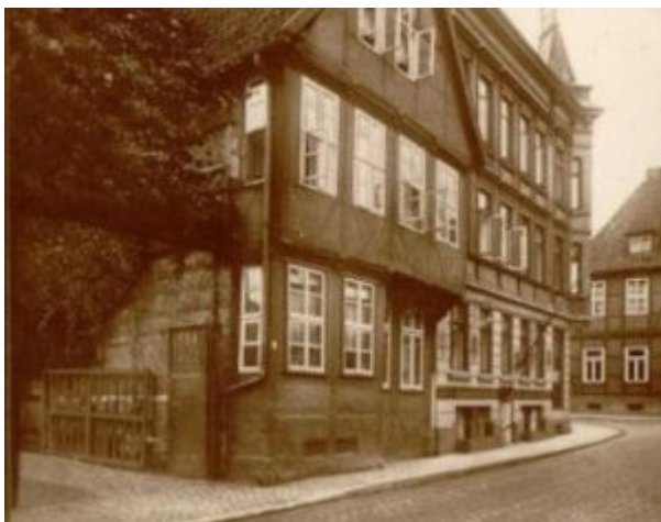
Die Kellerschänke in den 20er Jahren.