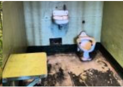
Schutz für Kunst und Kultur