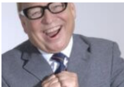
Choleriker trifft Heinz Erhard Jede Menge Sand in Seevetal