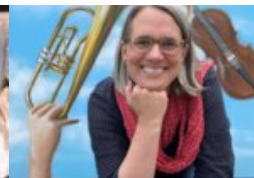
„Ein Klick zur Kultur“