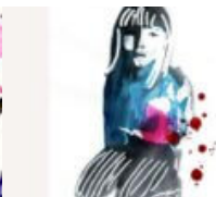
Mit Pinsel, Farbe und Kinderfoto die eigene Biogra...