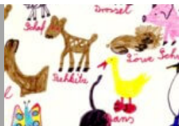
Biografiearbeit: Kinderzeichnungen vergessen nicht...