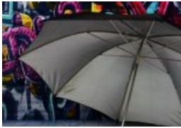
Jetzt kommt Hilfe!