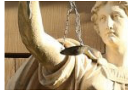
Vereinsitzung beim Kontaktverbot