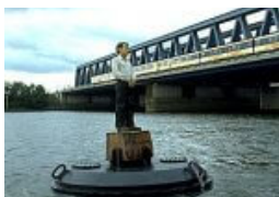
„Männer auf Bojen“ zurück