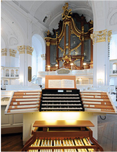
„Spieltisch“ im Michel

Staatsministerin Maria Böhmer erläuterte: „Orgelbau und Orgelmusik sind schon immer geprägt vom Austausch engagierter, kreativer und leidenschaftlicher Menschen. Diese Neugier hat an staatlichen Grenzen nie Halt gemacht. In Deutschland produzierte Orgeln erklingen heute weltweit, sei es in Japan, auf den Philippinen, in Brasilien oder den USA. Und auch Organistinnen und Organisten, die an deutschen Hochschulen ausgebildet wurden, sind auf der ganzen Welt gefragt und geschätzt. Die vielen zeitgenössischen Kompositionen für Orgel wie auch die kontinuierliche Entwicklung neuer Bautechniken zeigen, dass die Kultur des Orgelbaus und der Orgelmusik äußerst lebendig und wandlungsfähig ist.“