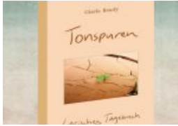
Ein Tagebuch des Traumas