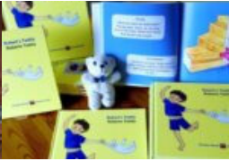
Das gereimte Kinderbuch