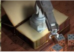
„Wir passten nicht ins Raster“