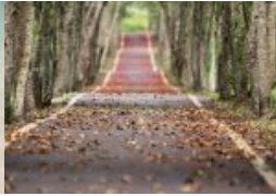
Blättern unter Bäumen