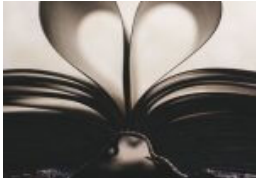
Mehr als nur Papier