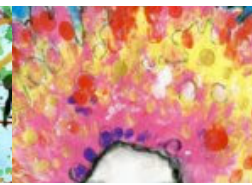
Krankheit als Lehrmeisterin