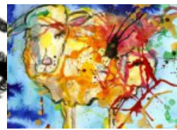
Gedanken eines Schlafschafs