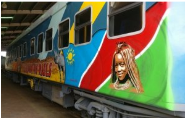
Trash-Art rollt künftig quer durch Namibia.

Im Laufe des Workshops sind die Jugendlichen zu einer Gruppe zusammen gewachsen und haben sich vom ersten Zeichnen bis zu Wandgestaltungen mit dem Thema Graffiti theoretisch und praktisch auseinandergesetzt.