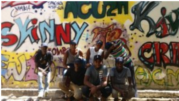
Bildung international: Studenten von Brozilla.

Der 38-jährige Urban Art-Künstler begann vor etwa vier Monaten mit der Planung seines Vorhabens.