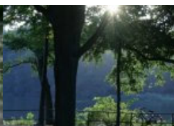
Ich – Du – Wir