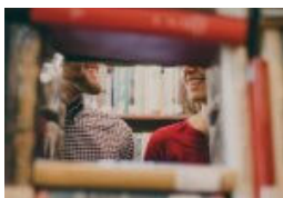
Projektfonds stärkt Kulturelle Bildung