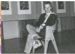
„Kunst kommt von Müssen!“