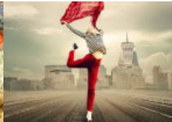
Toleranz oder Rotes Tuch