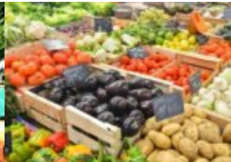
Vielfalt macht uns alle reicher