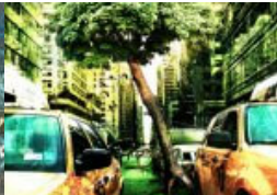
So oder so