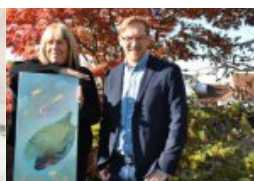
Art to go - Kunst zum